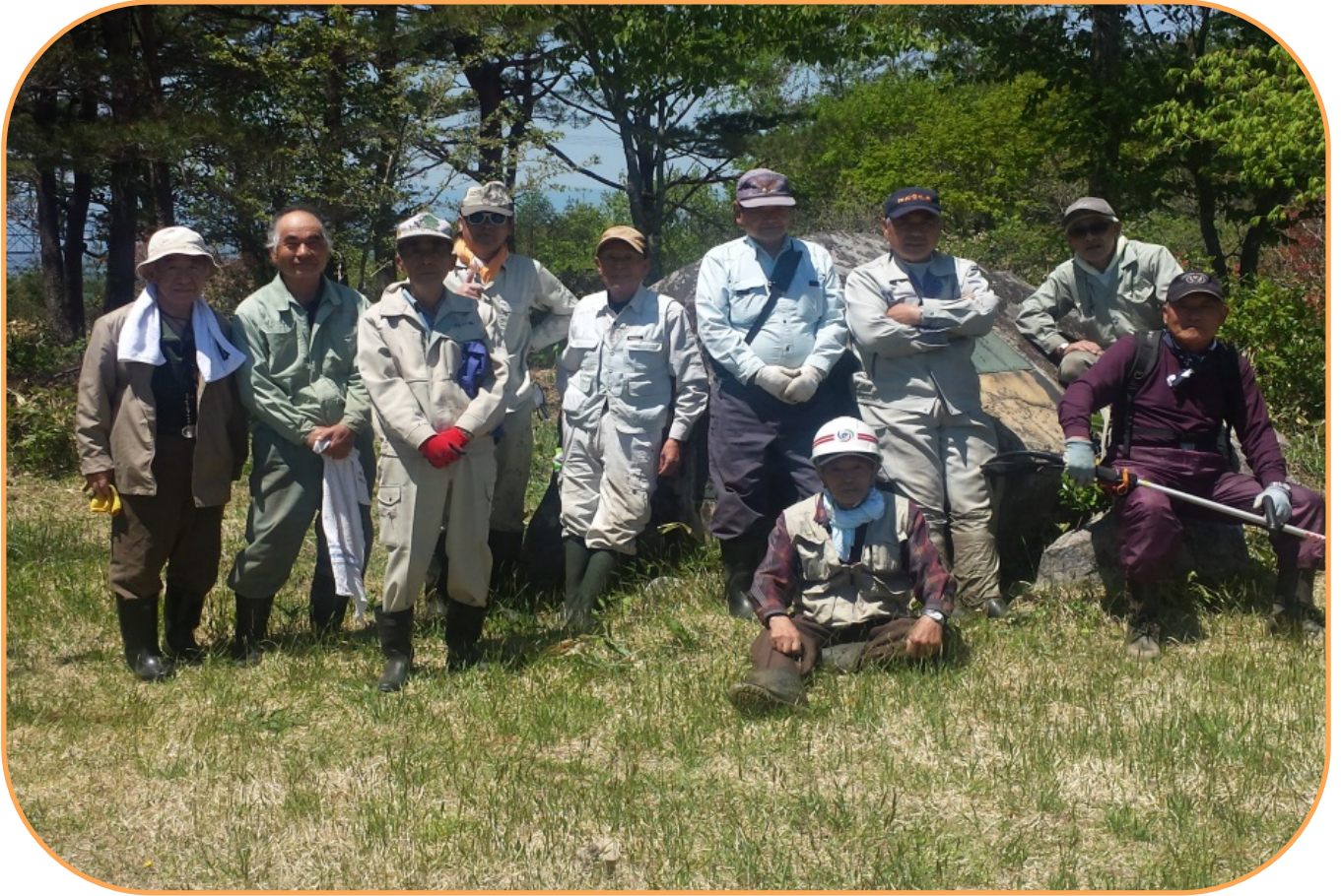
平均年齢 75 歳↑ 頑張ってます！